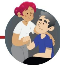
Cuando cuides enfermos