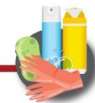
Limpia y desinfecta los objetos y superficies

Si presentas fiebre, malestar general, tos seca y/o dificultad para respirar, acude a la unidad de atención médica y