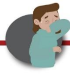
Cubre boca y nariz al toser o estornudar usando la parte interior del codo o con un pañuelo desechable