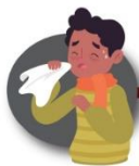
Evita contacto con personas que muestren síntomas de gripe o resfriado