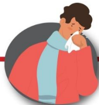
Después de toser o estornudar