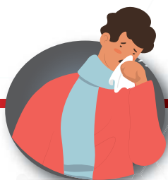
Después de toser o estornudar