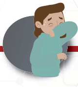
Cubre boca y nariz al toser o estornudar usando la parte interior del codo o con un pañuelo desechable