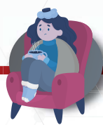
Quédate en casa cuando estés enfermo