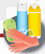
Limpia y desinfecta los objetos y superficies de mayor contacto

Si presentas fiebre, malestar general, tos seca y/o dificultad para respirar, acude a la unidad de atención médica y