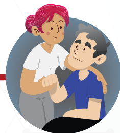
Cuando cuides enfermos