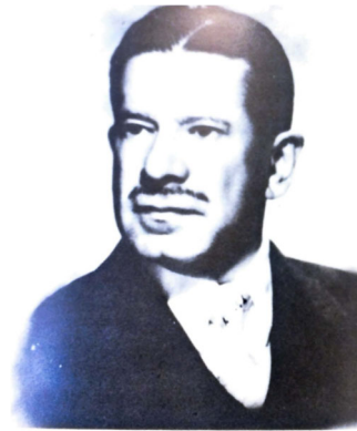
Fotografía obtenida de Asociación de Banqueros de México 1928-1978. Quincuagésimo Aniversario de la ABM.

Este personaje lo describimos más bajo el contexto del Cardenismo, no participó como Secretario de Hacienda, pero sí como presidente en la Asociación de Banqueros de México en el año de 1948, siendo sucesor de Luis Montes de oca. Él es destacado por su amplio conocimiento y desarrollo como banquero por lo que lo hacía un buen conocedor de la teoría monetaria y bancaria así como, del funcionamiento de las instituciones bancarias y de crédito. Debido a esto se le caracteriza como un intelectual especializado en estos temas, esto hacía que la mayoría de sus seguidores fueron empresarios. Durante su estancia como presidente de la